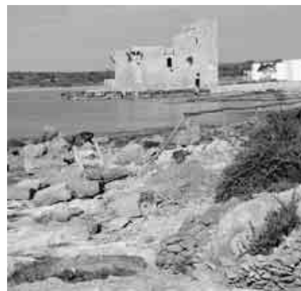
UNA VEDUTA DELLA RISERVA DI VENDICARI