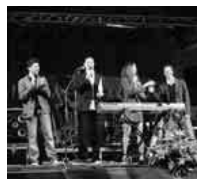
Un momento dell'esibizione di un gruppo canoro nell'ambito della manifestazione «CinemAvola»